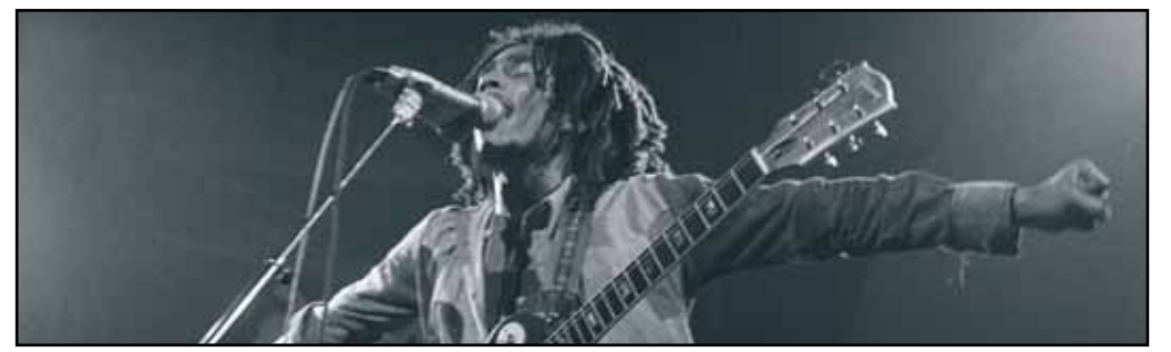
EVENTO SPECIALE: MARLEY - ARIANTEO PALAZZO REALE 26 GIUGNO