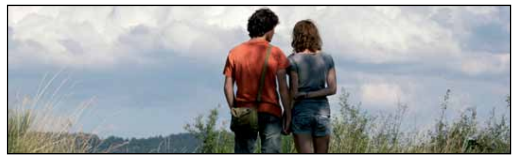
ANTEPRIMA: UN AMORE DI GIOVENTÙ - ARIANTEO PALAZZO REALE 19 GIUGNO