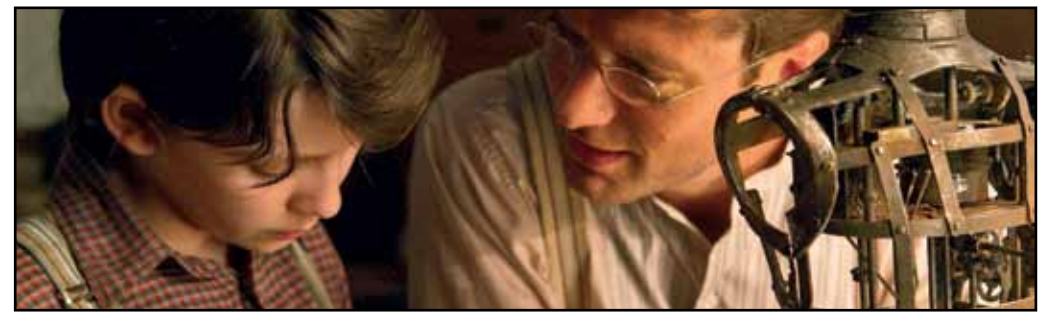
CINEMA PER LE FAMIGLIE: HUGO CABRET - ARIANTEO CASTELLO SFORZESCO 4 AGOSTO